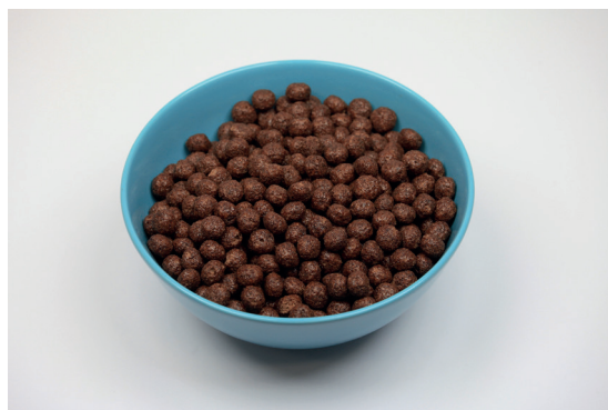
Reálně konzumovaná porce