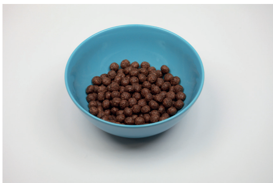
Doporučených 30 gramů

Problémem je i velikost porce. Ta, která nám připadá přiměřená, se velice liší od té doporučené výrobcem i odborníky (30 g).